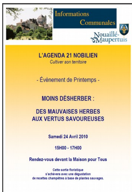
Invitation aux habitants - Nouaillé Maupertuis