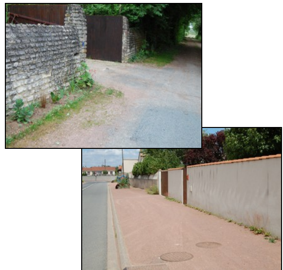
Bandes fleuries devant les habitations - St Jean de Thouars

En savoir + sur l'opération "Embellissons nos murs" :