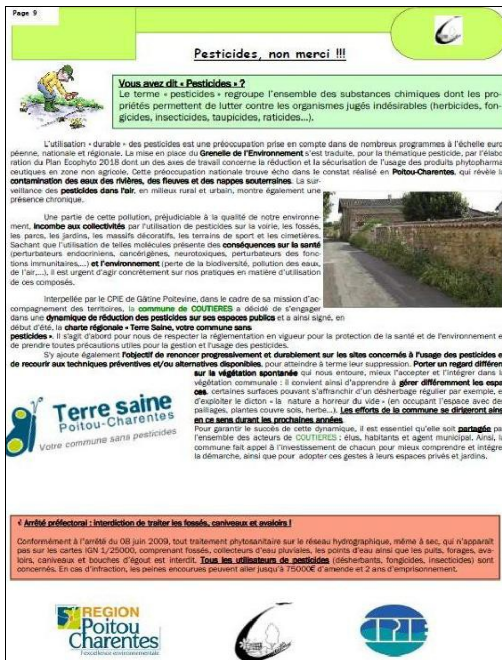
Article du bulletin municipal "Le Coutiérois" – Coutières (Octobre 2009)

Les bulletins municipaux sont des moyens privilégiés de communication vers les administrés. Les articles de ces bulletins peuvent expliquer à la population l'enjeu de la nouvelle gestion sans pesticides de la commune. Ils peuvent répondre aux interrogations des habitants sur le fait de voir plus d'herbe sur les trottoirs ou des prairies fleuries spontanées dans des endroits éloignés du centre ville. Il s'agit d'un moyen de communication pour toutes les communes qui n'ont pas toujours les moyens de faire des démarches plus conséquentes.